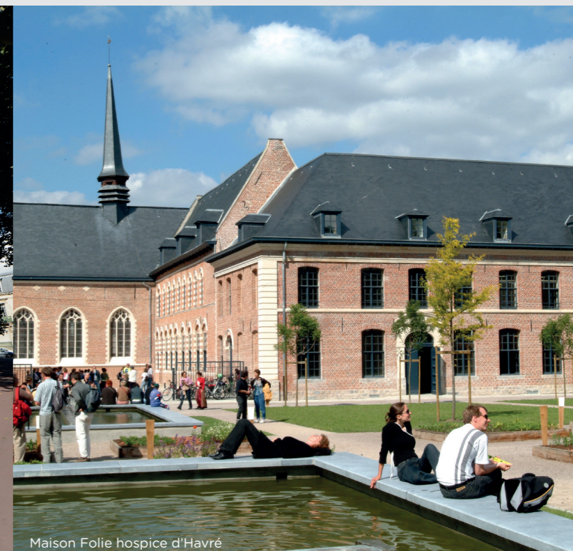
Maison Folie hospice d'Havré